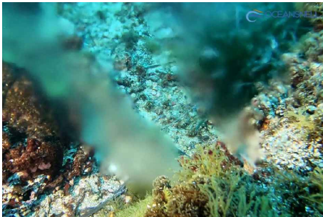
Imagen 7. Fuga 1 en junta PK 3+614