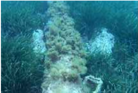
Imagen 5. Lastre final del tramo (cota -11 m)