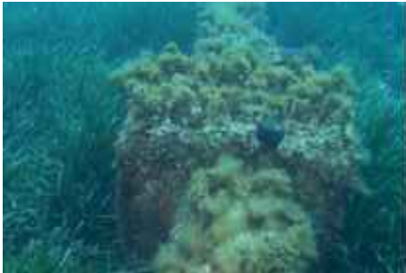
Imagen 4. Lastre inicial del tramo (cota -9 m)